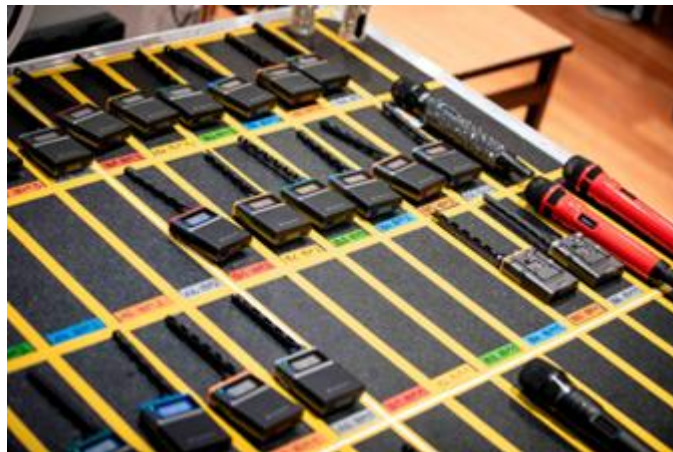
次のアクトに備えた「Specteraボディパック」と「ハンドヘルドマイク」

「ユーロビジョン・ソング・コンテストほど多くの冗長性を組み込んでいるテレビ番組制作はほかにありません。セットアップのほぼ全体に、即座に切り替え可能な完全なバックアップシステムが用意されています。実際、デュアルセットアップが機能しないものは、アーティスト本人と、その手にあるマイクであり、それが信号チェーン全体の中で最も重要な機材となります。「SpecteraハンドヘルドSKM」は、すぐに完璧なソリューションであることを証明しました。広帯域伝送による比類ないRF安定性と、マルチアンテナ機能の組み合わせにより、ORFがこの規模のショーにこれらの発売前の試作機を持ち込むという決断が正しかったと、制作側に即座に確信を与えました。」