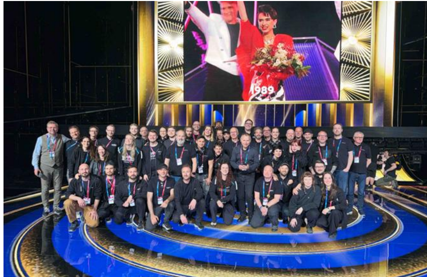
思いやりあふれるクルーたち — サウンドチーム全員がウィーンの聖アンナ小児病院への寄付活動に参加