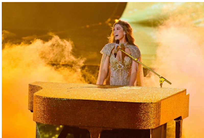
カスタマイズされたSpecteraハンドヘルド送信機を使用するオーストラリア代表のDelta Goodrem氏

「「Spectera」は、すべての人にとって作業をより容易なものにしました。出演者にとっては、その驚くほどクリアで空間的なインイヤーモニターのサウンドに感銘を受けただけでなく、ヘッドセットマイクを使用する際でも衣装の中に隠すボディパックが1つだけで済みました。着付けを担当するチームにとっては、衣装に組み込むボディパックが1つだけで済むことは大きな利点でした。そして最後に、私たちにとっても同様です。なぜなら、Specteraは運用上不可欠な機器の状態データ（ヘルスデータ）を提供してくれるからです。」